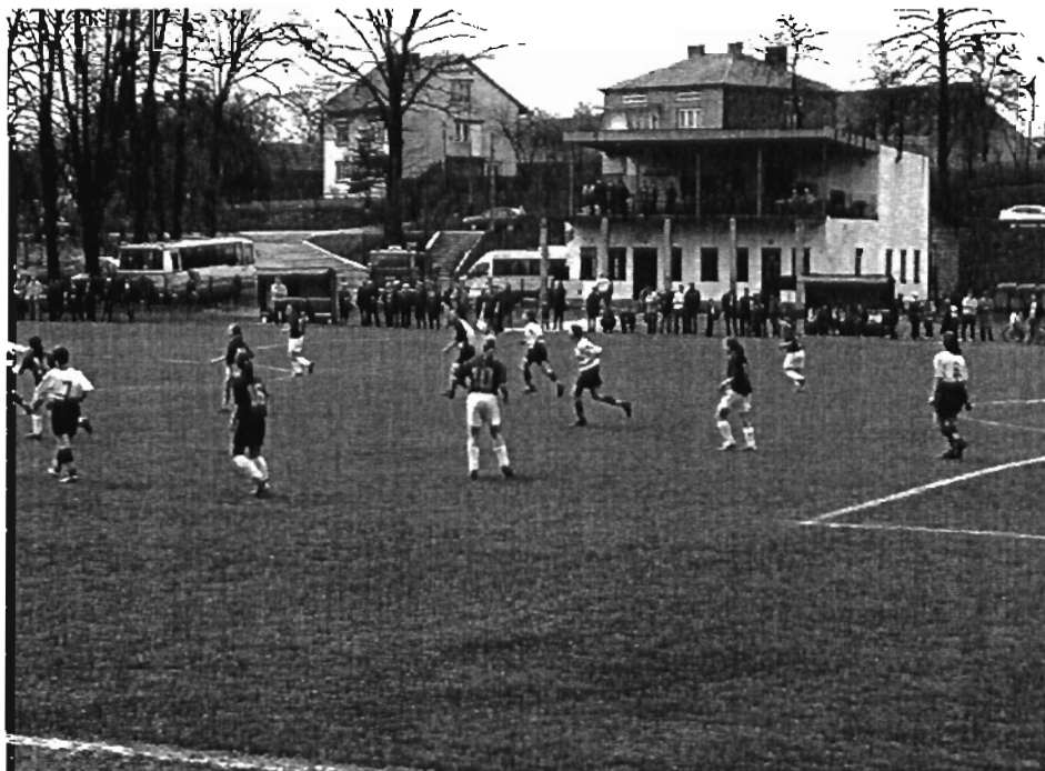
Rysunek 3 Szatnia sportowa i stadion w Grodzisku Górnym (budynek przed modernizacją – stan pierwotny)

Na umownej granicy wsi Grodzisko Górne i Grodzisko Dolne wzdłuż potoku Leszczyńka znajduje się obiekt sportowy – stadion wraz z bieżnią i odkrytymi trybunami oraz szatnią sportową. Klub sportowy prowadzi sekcję piłki nożnej, w której skupione są cztery drużyny piłkarskie męskie oraz jedna drużyna żeńska. Ponadto klub prowadzi sekcje tenisa stołowego i kolarską. Obiekt ten stanowi arenę nie tylko imprez sportowych i rozgrywek, ale przede wszystkim jest miejscem gdzie odbywają się cykliczne imprezy kulturalno – oświatowe w tym również o znaczeniu ogólnopolskim – Parada Straży Wielkanocnych (impreza cykliczna – co 2 lata). Obiekt ten stanowi w pewnym sensie centrum kulturalne wsi gdzie spotykają się wszystkie pokolenia mieszkańców.