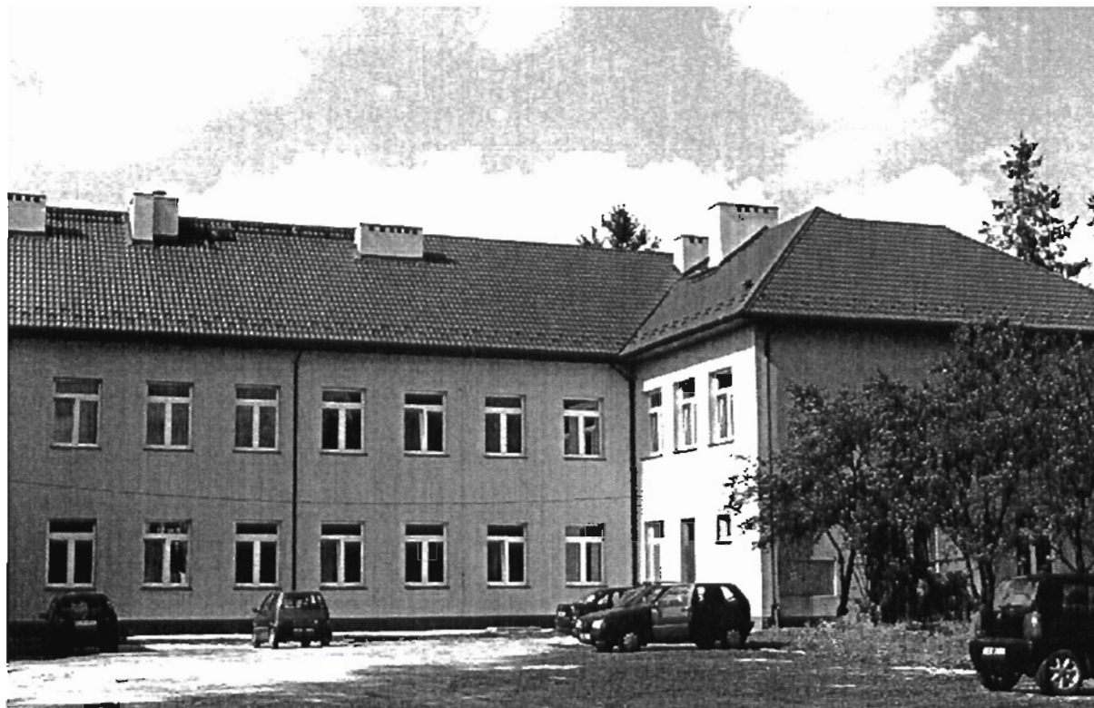
Rysunek 2 Zespół Szkół w Grodzisku Górnym im. Prof. Franciszka Leji (stan IX 2008)

We wrześniu 2007 roku, Szkoła przystąpiła do realizacji największego projektu edukacyjnego w Polsce, jakim są „Szkoly Jagiellońskie”. W ramach tego programu uzyskano wsparcie finansowe, w kwocie 113 128.76 zł. Dzięki pozyskanym środkom szkoła mogła zakupić dodatkowy sprzęt, w postaci aparatu fotograficznego, kamery cyfrowej, czy słowników edukacyjnych. W realizację projektu zaangażowano również liczną grupę dzieci i młodzieży, którzy chętnie uczestniczyli w różnego rodzaju zajęciach pozalekcyjnych, kółkach teatralnych, gimnastycznych i tanecznych. Dzieci mogły rozwijać swoje zdolności i zainteresowania z różnych dziedzin, przy okazji wspaniale się bawiąc. Z otrzymanej dotacji udało się sfinansować wycieczki m.in. do Krakowa, Warszawy, Lwowa i Krynicy oraz zakupiono stroje dla zespołu tanecznego i instrumenty dla orkiestry fletowej.