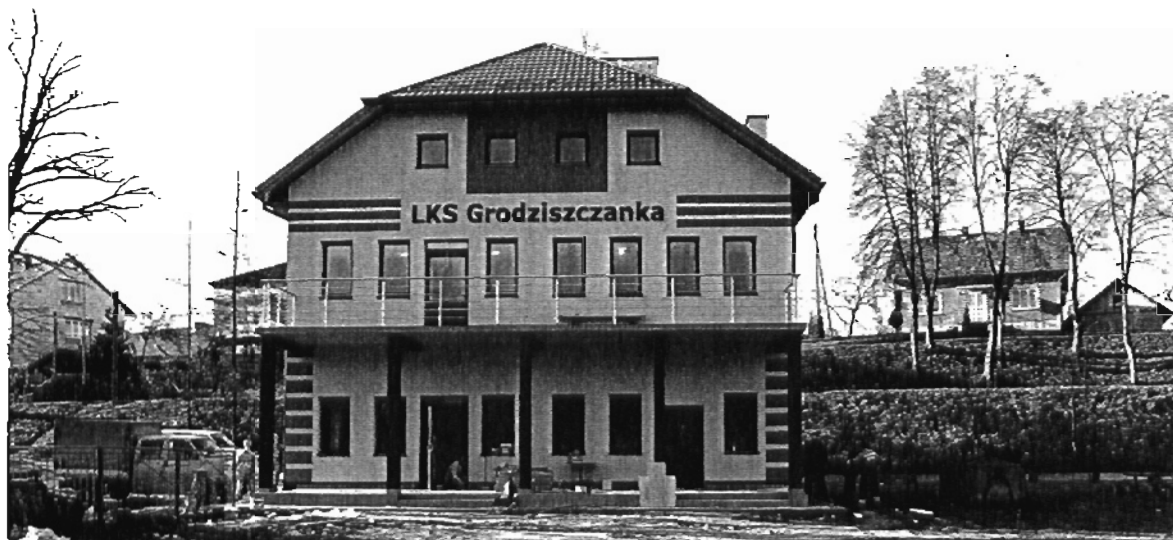
Rysunek 4 Szatnia sportowa w Grodzisku Górnym (stan listopad 2009)

Zgodnie z oczekiwaniami mieszkańców budynek szatni wraz z boiskiem ma się stać ogólnodostępnym centrum kulturalnym, sportowym i społecznym wsi. Zgodnie z sugestiami poszczególnych mieszkańców całego sołectwa Grodzisko Górne, zgłaszanych na zebraniach wiejskich, w trakcie nieformalnych spotkań oraz bezpośrednio u wójta, planuje się na bazie istniejącego budynku, stworzyć warunki do powstawania i funkcjonowania lokalnych stowarzyszeń, grup nieformalnych i kół gospodyń wiejskich.