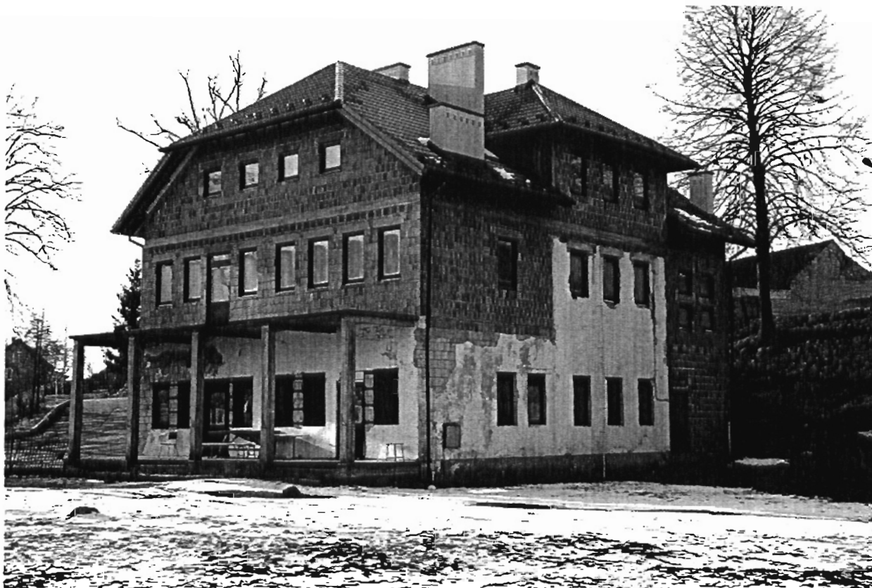
Rysunek 4 Szatnia sportowa w Grodzisku Górnym (budynek po częściowej modernizacji – stan rok 2008)

W latach 1994 – 1996 sporządzono i opracowano niezbędną dokumentację techniczną oraz uzyskano konieczne pozwolenia do przeprowadzenia modernizacji i rozbudowy całego stadionu wraz z urządzeniami towarzyszącymi (I etap inwestycji). Koszt tego etapu to 26 000 zł, w tym 15 000 w ramach budżetu gminy i 11 000 ze środków budżetu państwa. W roku 2005 nastąpiła aktualizacja i adaptacja istniejących projektów do nowych warunków i obowiązującego stanu prawnego (koszt 22 400 zł w całości pokryty ze środków budżetu gminy). Efektem realizacji II etapu inwestycji w latach 2006 – 2007 było nadbudowanie piętra do istniejącego budynku szatni, wykonanie nowego pokrycia dachowego oraz stolarki wewnętrznej i zewnętrznej, tzw. stan surowy zamknięty. Koszt II etapu – 420 000 zł, w całości ze środków własnych gminy.