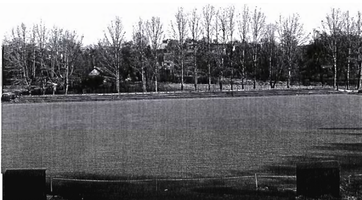
Rysunek 4 boisko sportowe w Grodzisku Górnym (stan listopad 2009)

Zgodnie z oczekiwaniami mieszkańców budynek szatni wraz z boiskiem ma się stać ogólnodostępnym centrum kulturalnym, sportowym i społecznym wsi. Zgodnie z sugestiami poszczególnych mieszkańców całego sołectwa Grodzisko Górne, zgłaszanych na zebraniach wiejskich, w trakcie nieformalnych spotkań oraz bezpośrednio u wójta, planuje się na bazie istniejącego budynku, stworzyć warunki do powstawania i funkcjonowania lokalnych stowarzyszeń, grup nieformalnych i kół gospodyń wiejskich.