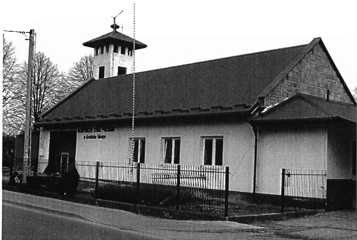
Rysunek Remiza OSP w Grodzisku Górnym (stan grudzień 2009r)