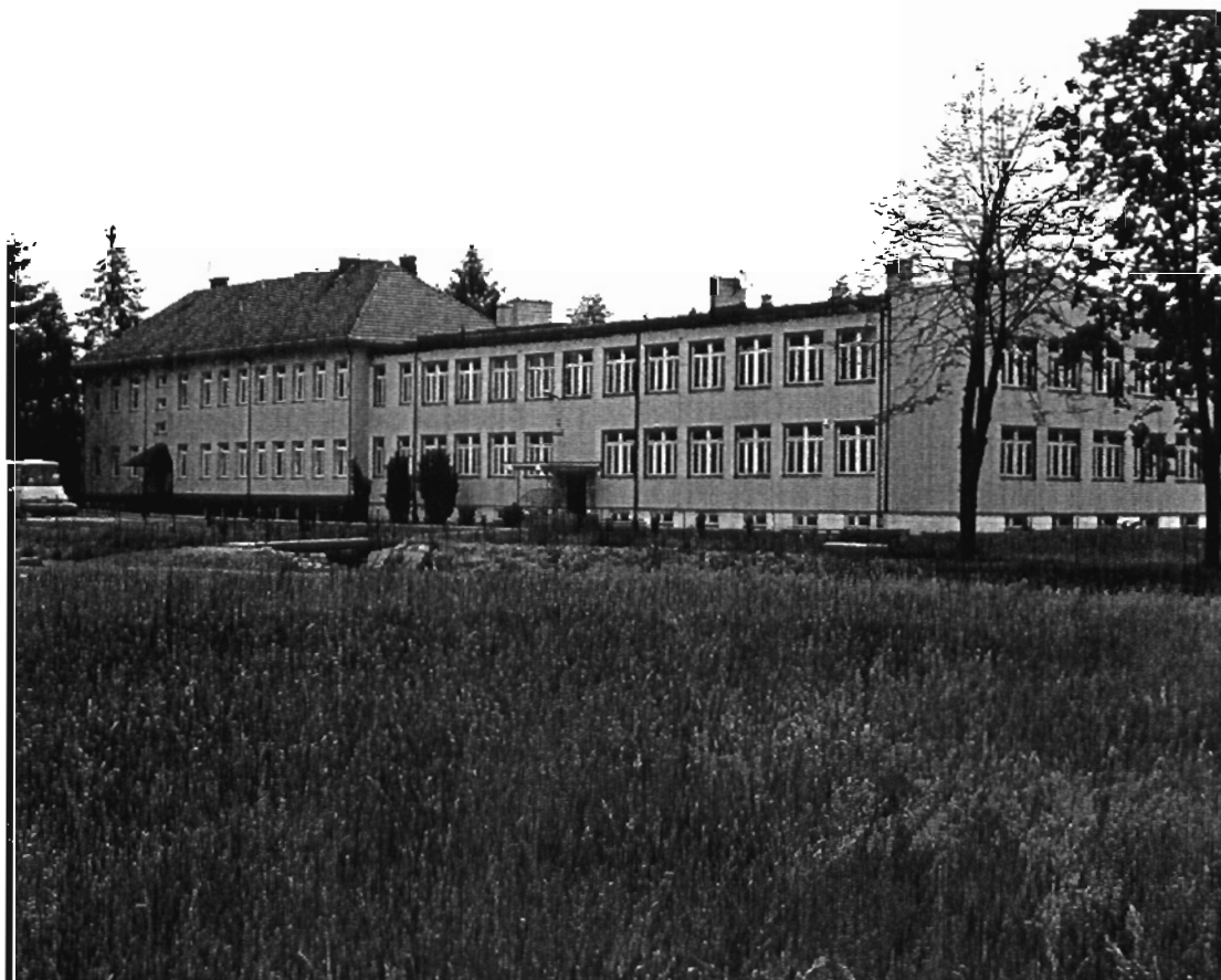
Rysunek 1 Zespół Szkół w Grodzisku Górnym im. Prof. Franciszka Leji (stan VI 2008)

W centrum wsi Grodzisko Górne przy drodze powiatowej znajduje się Zespół Szkół im. prof. Franciszka Leji. Mieści się tu Przedszkole Samorządowe, Szkoła Podstawowa i Gimnazjum, do której łącznie uczęszcza 410 osób, w tym 361 uczniów (dane z roku szk. 2007/08).